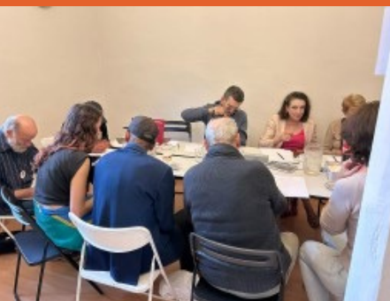
Forum de Lyon