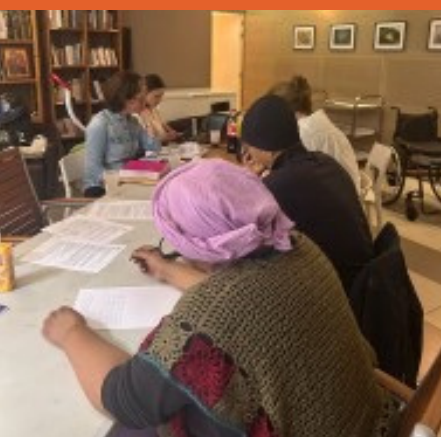
Forum de Paris

Le second semestre 2025 a été en partie consacré à l'élaboration et au lancement du projet Voix de la Rue, dont l'objectif est de permettre aux personnes directement concernées par l'exclusion de reprendre pleinement la parole dans les débats publics liés aux élections municipales.