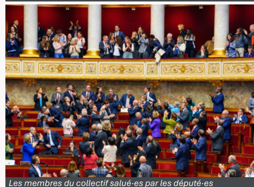
Les membres du collectif salués par les députés