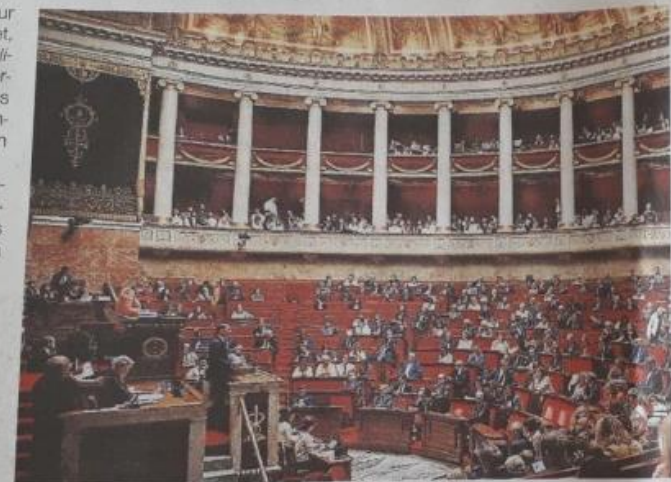
L'hémicycle de l'Assemblée nationale, à Paris, le 8 juin.